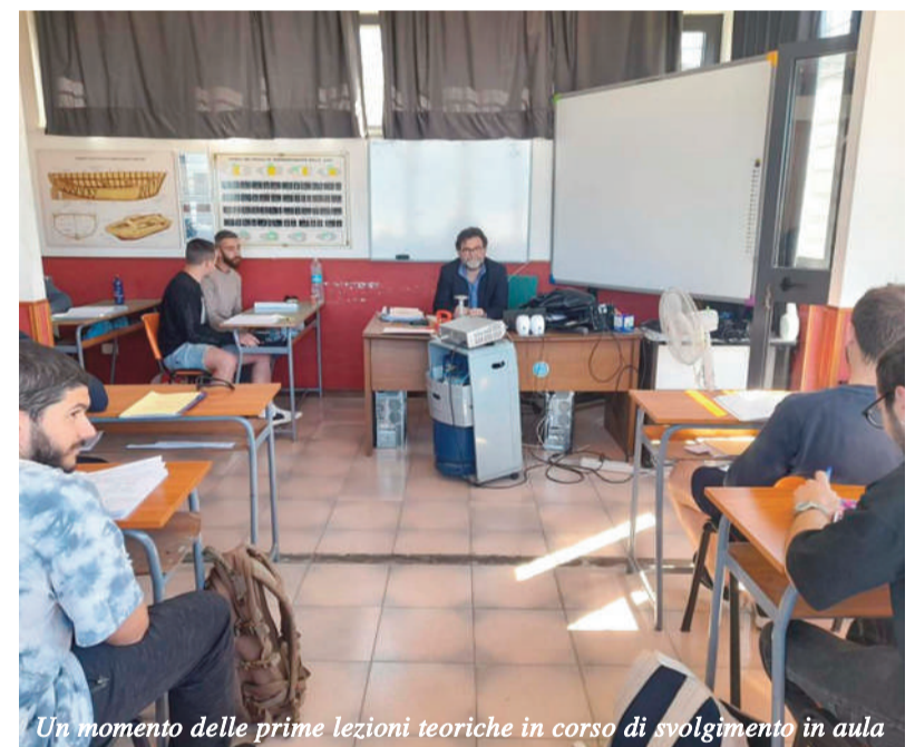
Un momento delle prime lezioni teoriche in corso di svolgimento in aula

Il corso "OTS-Inshore", che si concluderà il prossimo 8 luglio, è l'unico che consenta l'iscrizione al Repertorio Telematico della subacquea industriale (Legge Regionale 07/2016).