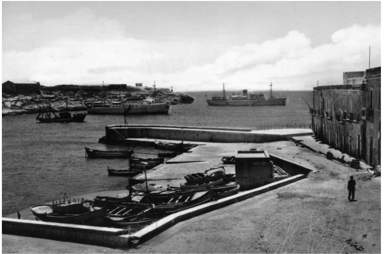
Porto di Lampedusa, 1961

Riunione a Palermo nei locali dell’Autorità di Sistema Portuale Sicilia Occidentale